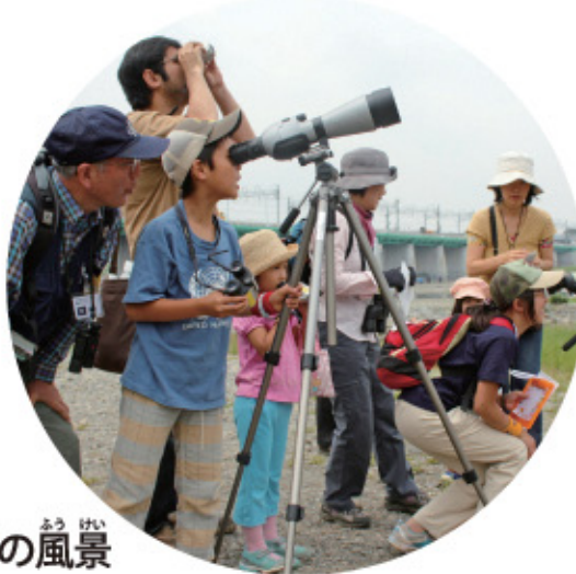
バードウォッチングの風景

世田谷の鳥を調査し守り伝える活動をしている「野鳥ボランティア」の皆さん。年に4回、観察会を多摩川や砧公園でやっているのだから参加してみよう。