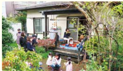
まちの子育て支援拠点とご近所サロン ふくふくのいえ（喜多見9-14-15）