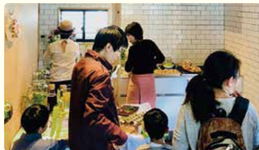
食を通じた多世代交流 ふかさわの台所（深沢2-15-3）