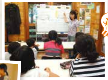
お金の使い方を学ぶ子どもたち (一社)凸凹Kidsすべいす♪