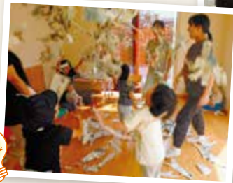
新聞紙を使って遊ぶ子どもたち NPO法人にじのこ