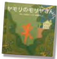
◀絵本「ヤモリのモリヤさん」