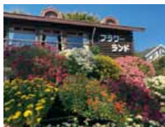
管理棟前の花飾り

花でいっぱいの花壇とともに、正面入り口に対で植えられたペニバナトチノキ(花の最盛期5月中旬)は、フラワーランドのシンボルツリーです。