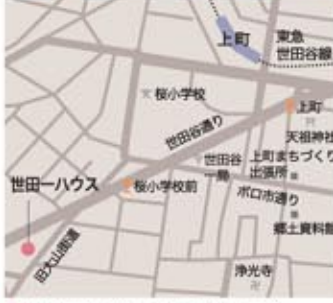
東急世田谷線 上町駅より徒歩5分 バス停 桜小学校前より徒歩1分