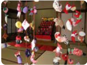
▲縁側の「つるし雛」越しの景色は、この時期ならではの

交通：東急または、小田急バス(二子玉川駅～成城学園前)「吉沢」下車徒歩6分／東急バス(千歳船橋～田園調布駅)「玉川病院入口」下車徒歩7分／東急バス(二子玉川駅～成育医療センター)玉川病院」下車徒歩1分