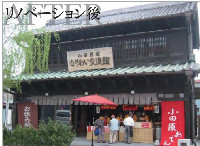
リノベーション後