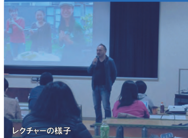
レクチャーの様子

そのため、参加者はセミナー当日までに、各自のプロジェクトの企画・提案をご用意いただくか、当方で用意した事例で検討していただくよう、お願いしております。