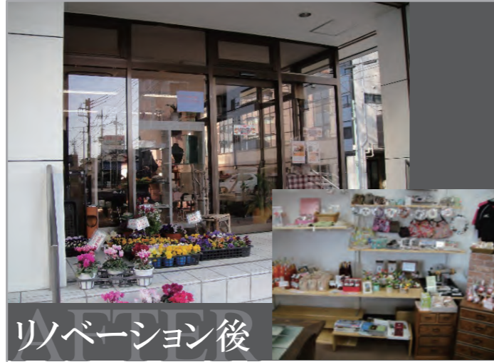
リノベーション後