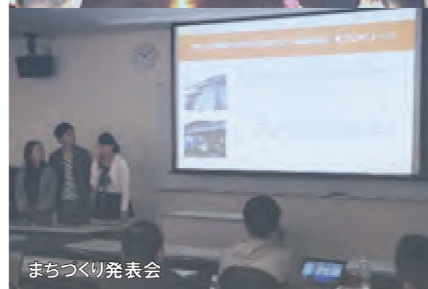
まちづくり発表会