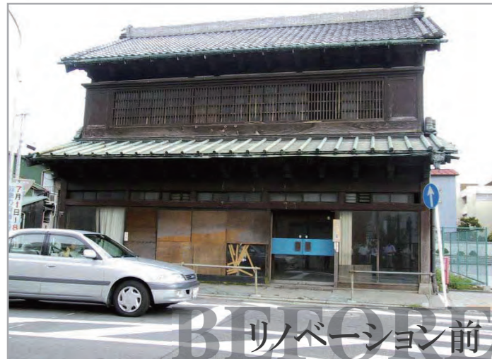
リノベーション前