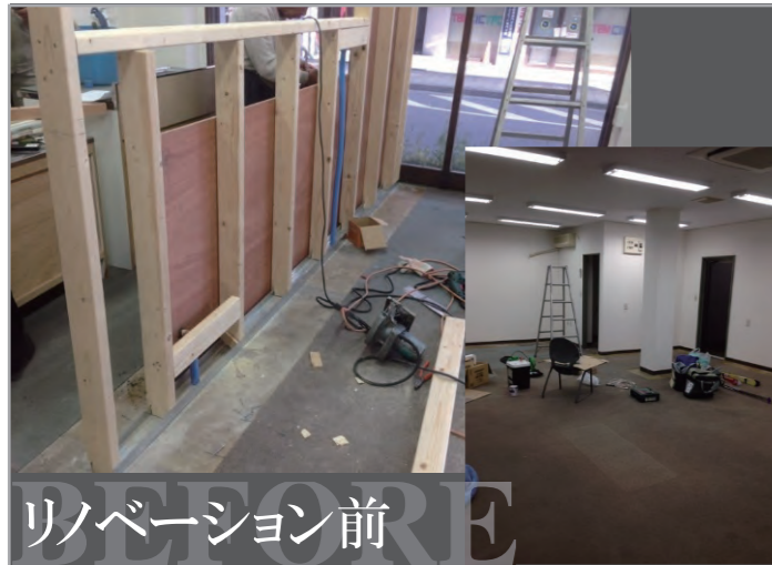
リノベーション前